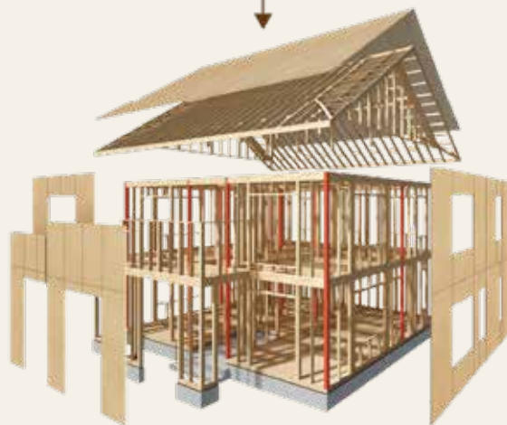
2つの構法を組み合わせた、耐震性に優れた「プレミアム・ハイブリッド構法」