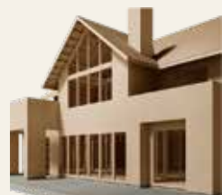
激しい揺れに抵抗する「モノコック構法」